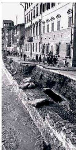
Un Lungarno distrutto dopo l'alluvione di Firenze

110 MILIONI di euro di cui finanziati e 80 da finanziare e suddivisi per metà fra Stato e Regione. Sono gli impegni in programma per un decisivo passo avanti verso la messa in sicurezza del bacino dell'Arno. Nel piano ci sono la cassa di espansione di Pizziconi (4,5 milioni di mc per 21 milioni di euro); la cassa di espansione di Restone nei pressi di Figline (5,5 milioni di mc per 15 mln); le casse di espansione di Prulli (6,5 milioni di mc per 25 milioni) e di Leccio (10,3 milioni di mc per 24 milioni) pronte a metà 2017. Inoltre si prevede il rialzo della diga di Levane dalla quota attuale di 169 metri a quota di 174. Il costo è intorno a 25 milioni di euro. I lavori di Enel potrebbero essere ultimati a metà 2018.